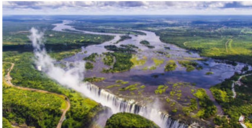
Vista durant el sobrevol en helicòpter de les Cascades Victòria

Acabada aquesta magnífica experiència, tornarem a l'hotel per gaudir de les seves instal·lacions i sopar a un dels seus restaurants.