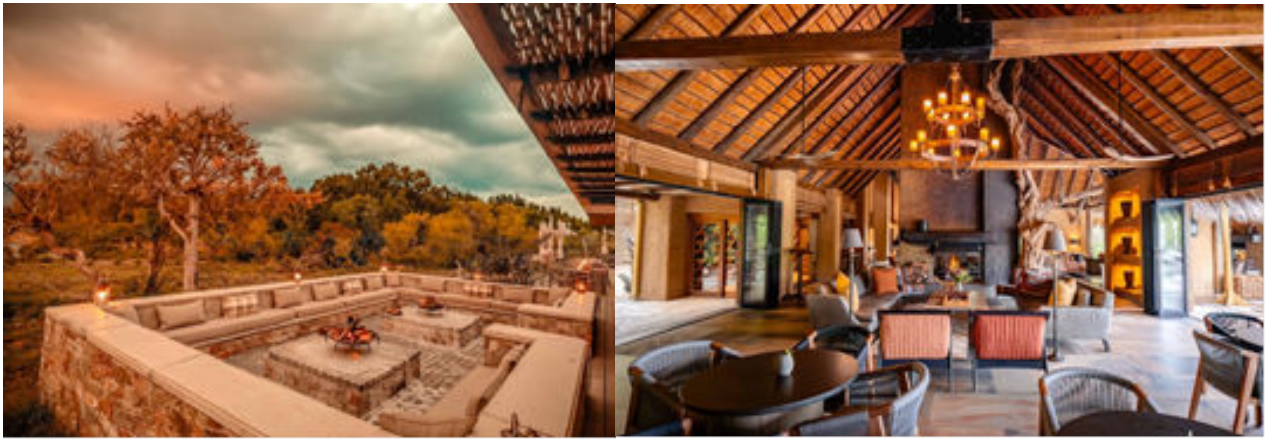
L'ambient exclusiu, acollidor i molt africà del nostre lodge

Durant la nostra estada de dues nits, gaudirem d'un excel·lent servei i d'una bona gastronomia, dormirem envoltats dels sons de la nit africana i sentirem moltes emocions inoblidables. Aquest mateix vespre ja farem la primera sortida en vehicles 4x4 per fer un safari abans de sopar i experimentar la profunda emoció que se sent quan s'està al mig de tanta grandiositat.