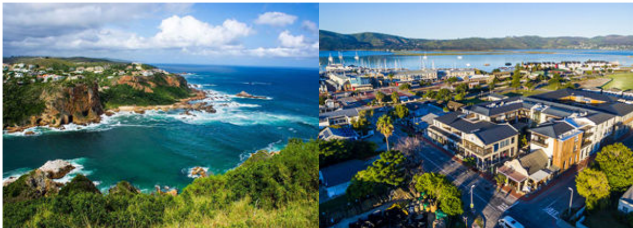
El nostre hotel i panoràmica de la llacuna de Knysna

Després d'esmorzar, anirem cap al Waterfront o front marítim de Knysna per fer una excursió panoràmica en vaixell per les tranquil·les aigües de la llacuna de Knysna fins a les dues roques que li guarden l'entrada i que es coneixen com "els caps". Haurem arribat a la Reserva Natural de Featherbed. Aquesta zona protegida ens permetrà gaudir de flora i aus autòctones de la Ruta Jardí i ens oferirà unes espectaculars vistes de la llacuna i de la ciutat de Knysna. Dinarem i retornarem al moll de Knysna en vaixell mentre gaudim del relaxant moment.