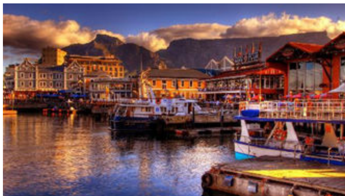
La Table Mountain vista des del Victoria & Alfred Waterfront

Després d'aproximadament 11 hores de còmode vol, aterrarem a Ciutat del Cap a les 11:50 h. Passarem el control de passaports, recollirem els equipatges i passarem el control de duana. Al mateix aeroport ens trobarem amb el nostre guia sud-africà que ens acompanyarà durant els propers dies. Ens traslladarem cap a l'hotel Commodore de 4 estrelles, situat a tocar de la millor zona de la ciutat, el Victòria & Alfred Waterfront, zona de moda i plena de centres comercials, restaurants i possibilitats d'oci. Farem un dinar lleuger al mateix hotel i deixarem els equipatges a les habitacions per després començar un tour panoràmic d'orientació en autocar per conèixer els inicis històrics de la ciutat, el castell de Bona Esperança, la plaça Greenmarket i el pintoresc i colorit barri de Bo-Kaap així com el centre financer de la ciutat.