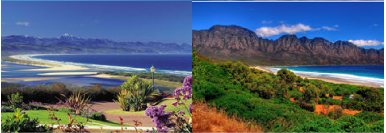
Espectaculars imatges de la Ruta Jardí

Continuarem la nostra ruta gaudint dels paisatges que han donat fama a la Ruta Jardí i els quilòmetres passaran molt més ràpid del que ens imaginem.