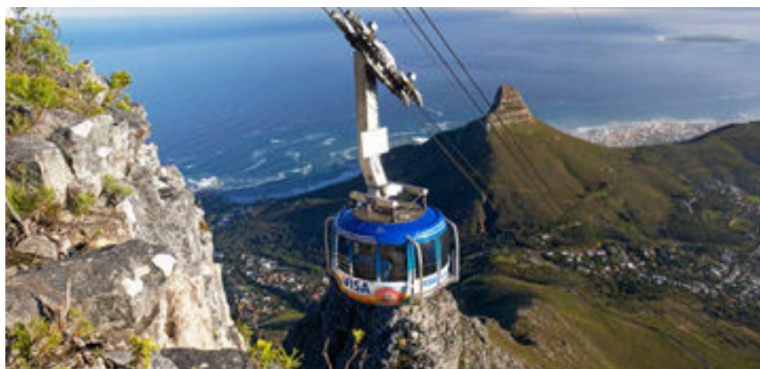
Telefèric giratori de la Table Mountain

Després de l'esmorzar, farem una inoblidable excursió de dia sencer. Començarem pujant al telefèric giratori a la Table Mountain, muntanya en forma de taula que és sense cap dubte, el símbol més conegut i fotografiat de la ciutat i que ofereix unes increïbles vistes. Aquesta pujada està subjecte a les condicions climatològiques.