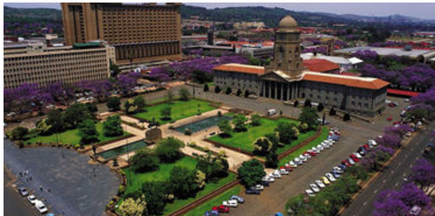
Centre de Pretòria

Esmorzar a l'hotel i sortida en autocar per fer una excursió de tot el dia que ens portarà primerament a visitar Pretòria, la capital administrativa del país on visitarem els monuments més importants i els edificis governamentals.