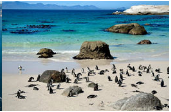
Pingüins a la platja Boulders

Anirem ja retornant cap a Ciutat del Cap, però farem abans una última parada al meravellós jardí botànic de Kirstenbosch, amb una excepcional mostra de flora autòctona de la regió del Cap, molt en especial de la flor anomenada King Protea, la flor nacional de Sud-Àfrica.