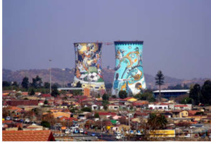
Imatge de Soweto

Acabada la visita, retornarem a l'àrea de Johannesburg per anar directament a Soweto (South West Township), lloc on va començar la revolució que va acabar uns anys més tard amb l'Apartheid i que avui és una vibrant i anàrquica ciutat de 3 milions d'habitants en constant evolució, plena de vida i contrastos i on encara es veuen les empremtes d'èpoques recents.