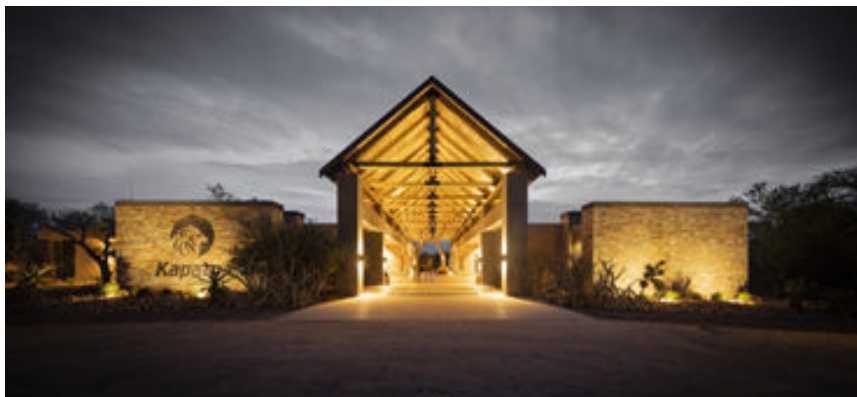
Entrada al Kapama River Lodge del Parc Kruger

Esmorzar a l'hotel i trasllat cap al molt proper aeroport de Johannesburg per facturar maletes i volar a les 10:30 h cap a Hoedspruit (Kruger East Gate Airport). Arribada a les 11:30 h, recollida de maletes i breu trasllat per carretera cap a dins del Parc Kruger on ens allotjarem a la magnífica i exclusiva reserva privada Kapama River Lodge, de 5 estrelles on gaudirem d'inoblidables experiències al llarg dels dos dies vinents.