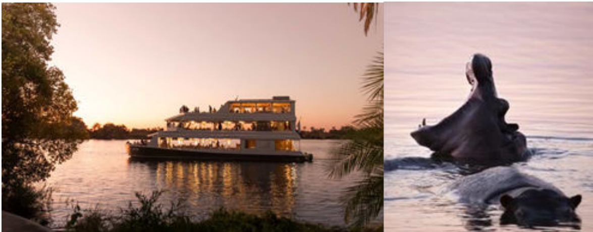
Creuer pel riu Zambezi a la posta de sol

Després de dinar, anirem en autocar cap al riu Zambezi per embarcar en un fantàstic creuer per les seves aigües mentre gaudim d'una posta de sol extraordinària i on possiblement podrem veure alguns dels animals que habiten a prop del riu tals com hipopòtams, cocodrils, elefants i moltes aus. Cal saber que és un salt d'aigua del mateix riu Zambezi el que forma les cascades Victòria, just a la frontera entre Zàmbia i Zimbàbue, molt a prop del lloc on ens trobarem.