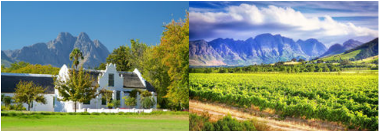
Arquitectura holandesa i paisatge de vinyes a prop de Franschhoek i Stellenbosch

Esmorzar i sortida cap a la regió vinícola del Cap amb màgics paisatges i muntanyes majestuoses. Primer visitarem la població de Stellenbosch, el veritable cor de la indústria del vi de Sud-Àfrica. Recorrerem les seves principals avingudes plenes de cases d'arquitectura de l'època dels holandesos i botigues tradicionals i continuarem cap a Franschhoek o racó dels francesos, ja que és el lloc on els Hugonots francesos es van refugiar després de les persecucions religioses del segle XVII a Europa.