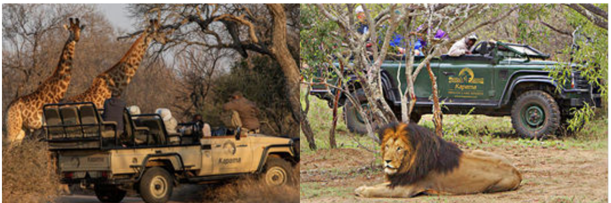
Imatges dels safaris a bord dels vehicles Jeep del nostre lodge

Dedicarem tot el dia a gaudir dels safaris, els serveis, la gastronomia i les instal·lacions del nostre Lodge com per exemple la piscina exterior que ens anirà molt bé per refrescar-nos a les hores centrals del dia. Ens llevarem molt aviat al matí i ens serviran un cafè amb galetes abans de fer la primera sortida en vehicles 4x4 i gaudir de l'alba mentre el nostre guia-ranger segueix el seu instint i experiència en la cerca dels "Big 5" o Cinc Grans: el lleó, l'elefant, el rinoceront, el lleopard i el búfal. Confiem que la sort ens somrigui.