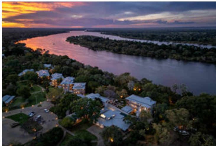
El Palm River Hotel a les Cascades Victòria

Després de dinar, anirem en autocar cap al riu Zambezi per embarcar en un fantàstic creuer per les seves aigües mentre gaudim d'una posta de sol extraordinària i on possiblement podrem veure alguns dels animals que habiten a prop del riu tals com hipopòtams, cocodrils, elefants i moltes aus. Cal saber que és un salt d'aigua del mateix riu Zambezi el que forma les cascades Victòria, just a la frontera entre Zàmbia i Zimbàbue, molt a prop del lloc on ens trobarem.