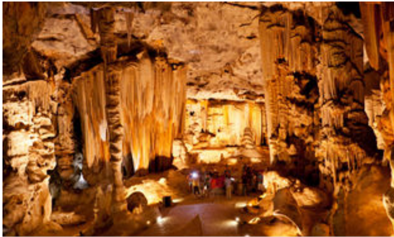
Una de les impactants sales de les Coves Congo a Oudtshoorn

A continuació, visitarem una granja d'estruços on ens explicaran com ponen els ous els estruços, què mengen, etc. i els més agosarats podran fins i tot muntar-ne un per experimentar la "velocitat" que aquests animals agafen.