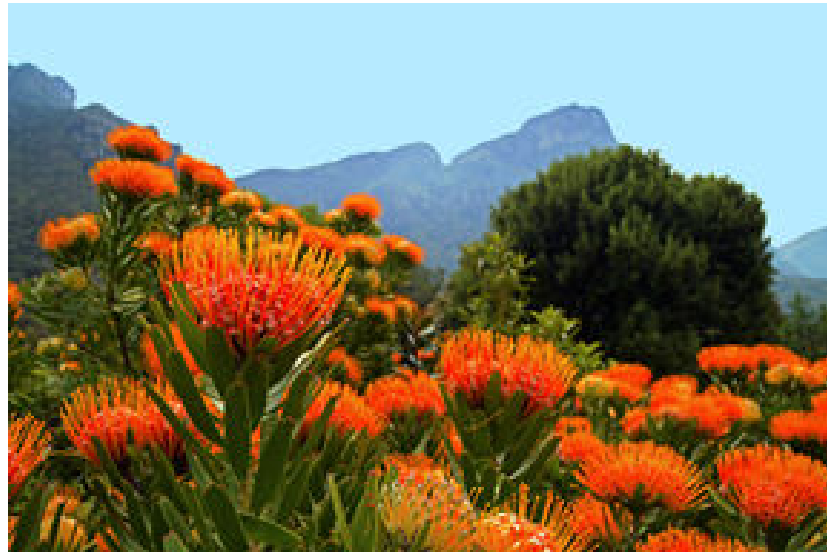
Jardí Botànic de Kirstenbosch i la King Protea, flor nacional de Sud-Àfrica

Anirem ja retornant cap a Ciutat del Cap, però farem abans una última parada al meravellós jardí botànic de Kirstenbosch, amb una excepcional mostra de flora autòctona de la regió del Cap, molt en especial de la flor anomenada King Protea, la flor nacional de Sud-Àfrica.