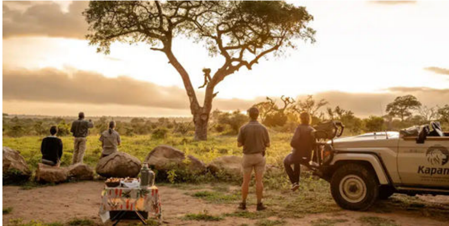
Prenent un cocktail "sundowner" en mig de la Sabana

A mig matí, tornarem al lodge i ens serviran un brunch per després gaudir lliurement de les instal·lacions i descansar. A mitja tarda i després d'un berenar lleuger que ells anomenen "High Tea", farem el segon safari del dia fins a la posta de sol que celebrarem enmig de la sabana amb una copeta de vi mentre el sol s'amaga davant dels nostres ulls. Després d'aquesta parada, tornarem cap al lodge, ja pràcticament de nit i enmig d'un ambient totalment màgic.