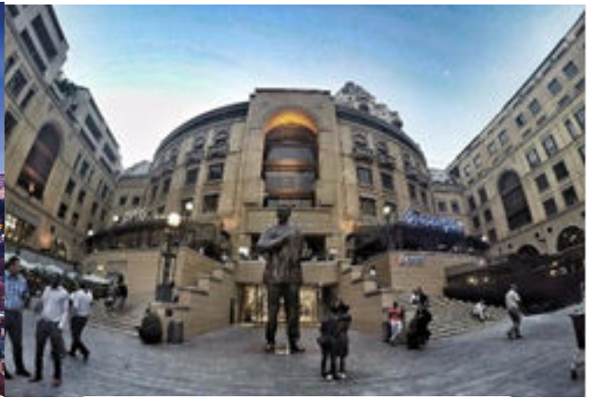
Estàtua de Nelson Mandela a Sandton

Després de deixar els equipatges a les habitacions podrem gaudir d'una mica de temps lliure i a l'hora convinguda anirem a sopar a un restaurant del barri. Retorn a l'hotel per descansar.