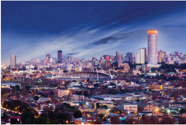
Vista panoràmica del centre de Johannesburg