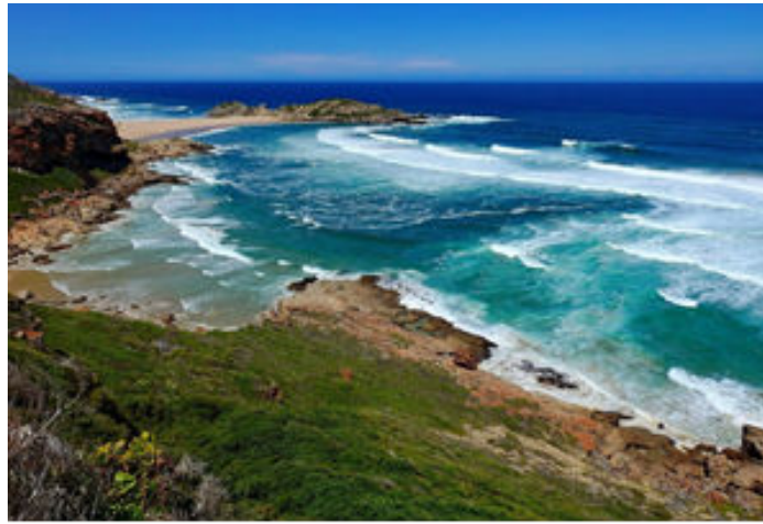
Les aigües de l'Índic a Pelttenberg Bay

Facturarem maletes i a les 15:45 h volarem amb la companyia Airlink cap a Johannesburg on aterrem a les 17:20 h. Després de recollir maletes ens traslladarem cap a l'hotel Peermont Mondior, situat molt a prop de l'aeroport i que forma part del complex comercial i d'entreteniment "Emperors Palace" amb carrers de botigues, bars, casino i atraccions diverses. Avui soparem al mateix hotel.