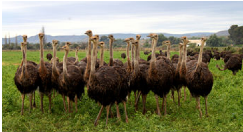
Visita a una granja d'estruços a prop d'Oudtshoorn

A continuació, visitarem una granja d'estruços on ens explicaran com ponen els ous els estruços, què mengen, etc. i els més agosarats podran fins i tot muntar-ne un per experimentar la "velocitat" que aquests animals agafen.