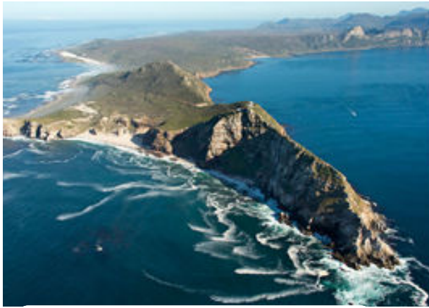
El Cap de Bona Esperança